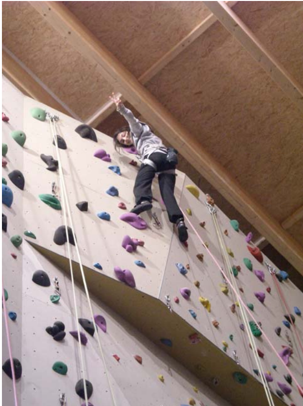
Kader in Siegerpose nach erfolgreichem Durchstieg

An den unterschiedlich steilen Wandbereichen der Halle sind am Wandfuß die Namen und die Kletterschwierigkeiten der Kletterrouten angebracht (in Wetzlar beginnen die